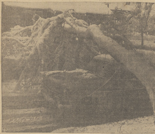
Śnieżyca jaka nawiedziła Colorado, pokryła Denver dwoma stopami śniegu.