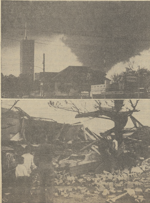
Niszczące siły orkanu w Dallas, Tex., zburzyły 60 bloków domów mieszkalnych, zabijając 9 osób i raniąc wiele innych.

Dругie zdjęcie przedstawia jedną z scen katastrofalnej burzy (ciężka płyta żelazna owinięta dokoła pnia drzewa, świadczą o sile wichury). Dallas ogłoszono ośrodkiem katastrofy. Rząd organizuje natychmiastową pomoc.