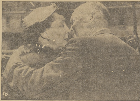
Sentymentalna scena — prezydent Eisenhower całuje małżonkę, opuszczając Waszyngton w drodze na Narodową Konferencję Kobiet Republikańskich.