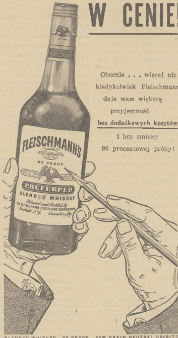
BLENDED WHISKEY • 90 PROOF • 65% GRAIN NEUTRAL SPIRITS THE FLEISCHMANN DISTILLING CORPORATION, NEW YORK CITY

Obecnie... więcej niż kiedykolwiek Fleischmann daje wam większą przyjemność bez dodatkowych kosztów i bez zmiany 90 procentowej próby!