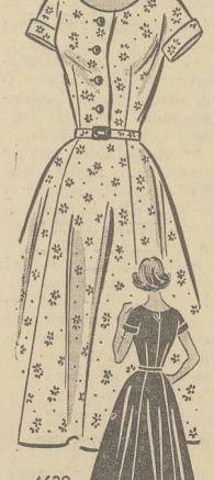
4639 SIZES 12-42 by Anne Adams

Łatwo do uszycia fason. Dopasowany stanik, głęboko wycięty — spódniczka o sześciu kilnach. Nr. 4639 przechodzi w rozmiarach 12, 14, 16, 18, 20, 40 i 42.