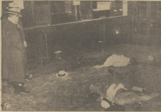
W Chicago na ul. State, miała miejsce walka policji z włamywaczami, w której 8ch przestępców zostało zabitych. Z biorących udział 7 policjantów, wszyscy wyszli bez szwanku.