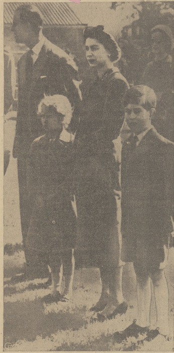
Królowa angielska, Elżbieta II, w towarzystwie męża i dzieci odwiedziła bawylskich w Anglii, w Combermere, członków sławnej kanadyjskiej policji konnej.