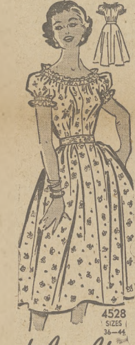
4528 SIZES 36-44 by Anna Adams