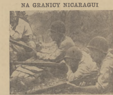
Wojska Nicaragui znajdują się na pograniczu Hondurasu, gotowe do strzału, podczas gdy czynione są wysiłki dla zorganizowania sytuacji.

Wspólny wyjazd na mecz nastąpi o godzinie 1:30 po południu z przedziału Pulaski przy S. 15 ul. i W. Grant ulica. (11)