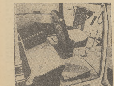
Tak wygląda wnętrze nowego helikoptera, przeznaczonego do przejazdu Prezydenta z Białego Domu na lotnisko w Washingtonie.