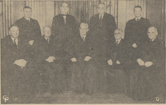
Członkowie Najwyższego Sądu w St. Zjedn. stanęli do nowej fotografii w Washingtonie. Od lewej siedzą: William O. Douglas, Hugo L. Black, J. Brennan, Jr., Tom C. Clark, John M. Harlan, Charles E. Whittaker, Chief Justice Earl Warren, Felix Frankfurter, Harold H. Burton. Stojący są: William