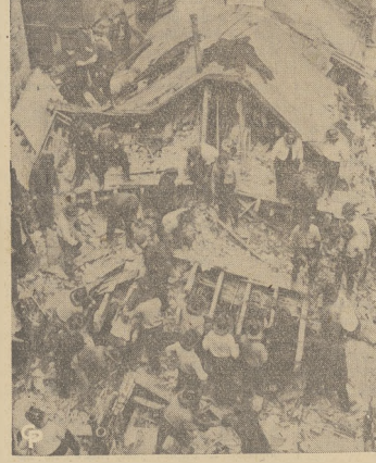
Obraz przedstawia ruiny, które przed zawaleniem się stanowiły przy piętrowy czynszowy dom w wschodniej części Nowego Yorku. Strażacy przeskazywają gruzy w poszukiwaniu ewentualnych ofiar. Jedną raną osobę znaleziono, a przynajmniej jedna osoba jeszcze jest zagrzebana. W budynku tym mieszkało 5 rodzin; tylko narkotyki odnaleziono.