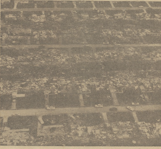
Ruskin Heights, przedmieście Kansas City, po zniszczeniu przez trąbę powietrzną. Po jednej stronie ulicy widoczne nietknięte budynki, podczas gdy druga jest kompletnym rumowiskiem.