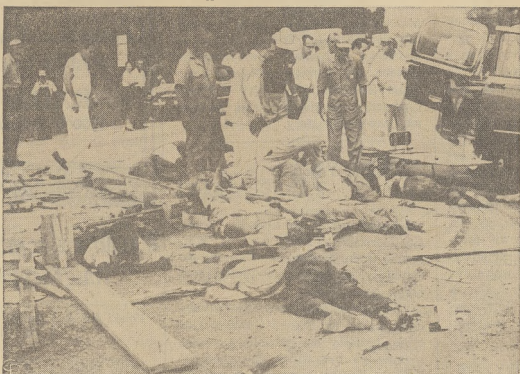
Na drodze z Mount Olive, N. C. do Dunn w zderzeniu się dwóch aut ciężarowych...