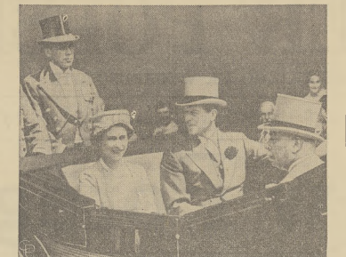
Królowa Elżbieta II w towarzystwie małżonka przybyli otwartą karetą na otwarcie słynnych wyścigów konnych w Ascot. Na prawo księżną Gloucesteru, wuj królowej.