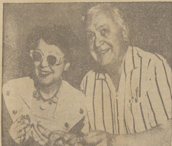
Śpiewak oper wagnerowskich Lauritz Melchior, ogląda z żoną część biżuterii, odzyskanej po okradzeniu ich domu.