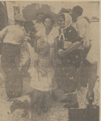
Mieszkańcy miejscowości Cameron w Louisianie, która odczuła najbardziej przejście huraganu "Audrey", pozabawieni domostw i dobytku, zmęczeni snują się wśród ruin.