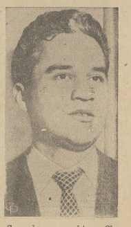
Syn sławnego aktora Charlie Chaplina, znowu stał przed sądem w Los Angeles pod oskarżeniem, jakie miał kilkakrotnie: jazda po pijanemu i wywołanie awantury.