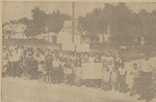
W miejscowości North Lake, Ill., matki na znak jeżdżącym kierowcom urządziły barykadę, domagając się ście 15 mil. na godz.