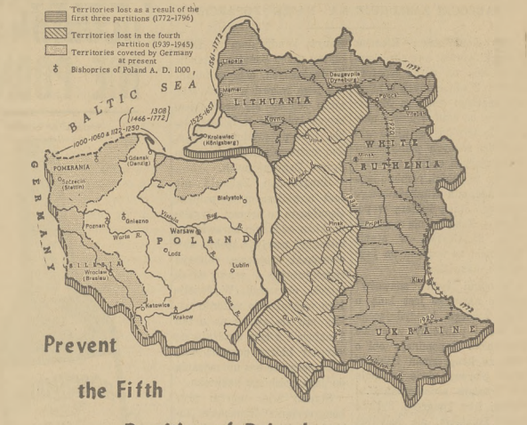
Mapa rozbiórów Polski, opracowana przez organizację Prevent The Fifth Partition of Poland, dla przeciwdziałania propagandzie rewizjonistów niemieckich.

Konkurs wydany za wykonanie opracowania w obronie Polski, przeciw planowi rozbiórki, proponowanemu (już po raz drugi w kongresie St. Z.) przez kongresmana Reece'a.