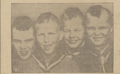
Gi czterej chłopcy z Roanoke, Va., są sensacją złotu harcerskiego w Valley Forge, Pa. Wystarczy im się przyzreć, by wiedzieć dlaczego.