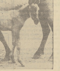
Niemiecy uczeni przez prowadzenie eksperymentów otrzymali wreszcie rasę konia, który żył przed 300 latami. Zrebak, żywy wynik ich eksperymentów znajduje się obecnie w Chicago w "Brookfield" w ogrodzie zoologicznym.