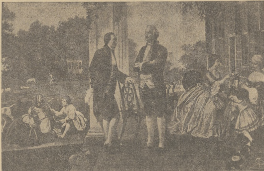
Markiz de LaFayette rozmawia z gen. Jerzym Washington'em na werandzie w domu w Mount Vernon, Va.