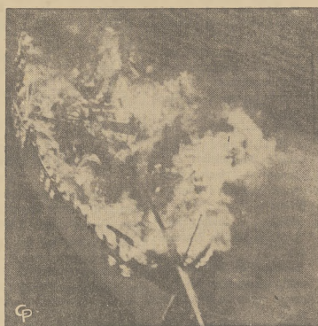
"Reveille", 32 stopowy yacht stanął w plomieniach niedaleko od Jacob Ride Park w Far Rockaway, N. Y. Załoga tego statku, składająca się z trzech studentów, została uratowana przez innych yacht. Młodzieńcy znajdują się w szpitalu w Beach. Jeden jest poparzony, a dwóch jego kolegów doznało wstrząsu.

przez innych yacht. Młodzieńcy znajdują się w szpitalu w Beach. Jeden jest poparzony, a dwóch jego kolegów doznało wstrząsu.