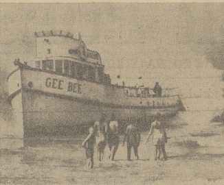
"Gee Bee", 63-stopowy kuter rybacki wartości $65,000 ugrzązł na plaży w pobliżu Santa Monica, Calif. Sternik kierujący statkiem zasnął przy kierownicy.