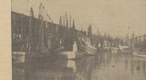
Port Liverpool, założony jeszcze przez Wikingów, w roku 1207 otrzymał prawa miasta portowego.