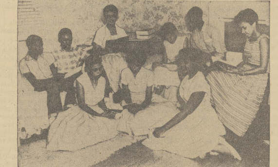
Dziewięcioro dzieci murzyńskich, którym zabroniono wstępu do wyższej szkoły Central w Little Rock, Ark. podczas kontrowersji integracyjnej, zebrano się w domu jednego z nich, gdzie udzielił eks-