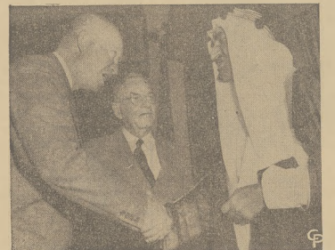
Prezydent Eisenhower wita Księżniczkę Faisal'a ze Sudań Arabii, gdy spotkali się w Białym Domu, by przedyskutować sprawy Środkowego Wschodu. Sekretarz Stanu John Dulles (w środku) brał również udział w tej rozmowie.

finansowanej przez Stany Zjednoczone, oraz organizacji SEATO, jeśli nowy dyktator tego państwa zostanie przyćnięty do obozu komunistycznego. Może on stać się ważnym problemem dla polityki amerykańskiej na Dalekim Wschodzie.