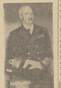
Król którego hasłem było "Wszystko dla Norwegii", posiadał w tym kraju wielką popularność, to też żałoba jest powszechna i głęboka.

OSLO, Norwegia. — W sobotę nad ranem zmarł we śnie najstarszy z monarchów świata, król Norwegii Haakon VII, przeżywszy 85 lat.