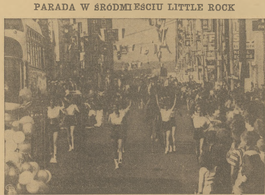
Z wyżej przedstawionej sceny nie można domyślić się, że obecnie są jakieś zamieszanie integracyjne w Little Rock. Jest to jedna z wielu parad, które odbyły się w tym mieście w ostatnim tygodniu. W tle widać wieżę kościoła.

Parada w Śródmieściu Little Rock. Jest to jedna z wielu parad, które odbyły się w tym mieście w ostatnim tygodniu. W tle widać wieżę kościoła.