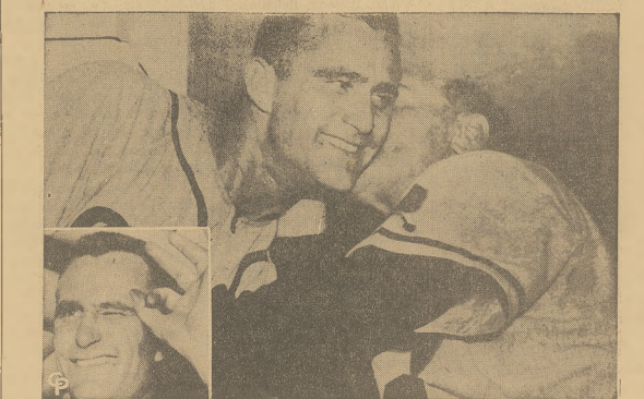
Manager Fred Haney of the new World Champion Milwaukee Braves embraces his "winningest" pitcher, Lew Burdette after the latter

slammed the door on the Yankees to give his team the pennant. "If he could cook, I'd marry him," said the exuberant Haney of his Nitro, W.