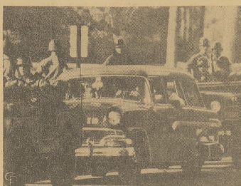
Murzyński studenci ze szkoły Central High, w Little Rock, Ark. wczoraj po lekcjach do domu wojskowym samochodem, w otoczeniu uzbrojonej Gwardii Narodowej.