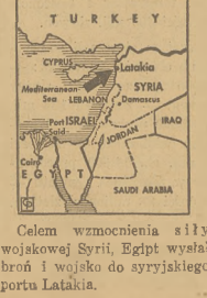
Celem wzmocnienia siły wojskowej Syrii, Egipt wysłał broń i wojsko do syryjskiego portu Latakia.