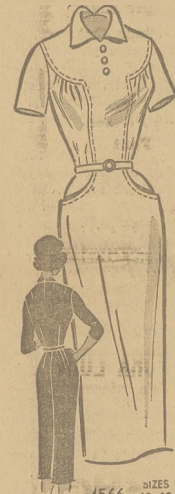
by Anne Adams

Nowy jesienny fason. Drukowane instrukcje. Nr. 4566 przychodzi w rozmiarach 10, 12, 14, 16 i 18. CENA MODELKA 50 CENTÓW.