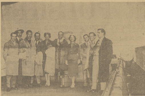
Artyści "Wagabundy" po przybyciu z Polski "Batorym" do Montrealu. W dniu 16 listopada wystąpią w Milwaukee.