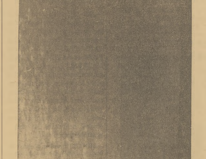
Na zdjęciu widzimy brzeg słońca, który został sfotografowany przez teleskop z balonu. Balon wznosił się w miejscowości Huron S. D. 17 października i osiągnął wysokość 83,000 ft. To był drugi balon, który wyruszył do stratosfery w celu badań ciała niebieskich.