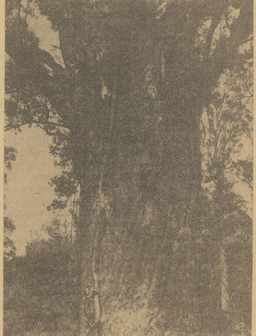
W Forest Park znajduje się drzewo ogromnych rozmiarów, co jest uwidocznione w proporcji z człowiekiem.