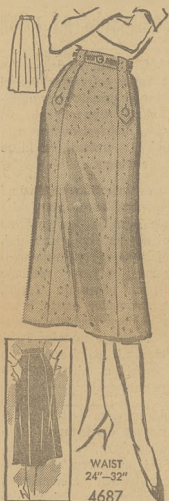
WAIST 24"-32" 4687