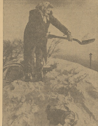
Słońce świeci ale nie wszędzie. Sę miejscowości gdzie zima jest już w całej pełni, a z nią mróz i śnieg, jak to widoczne na zdjęciu. Trzeba oczyścić ulicę od śniegu i auto, które zostało doszczętnie zasypane. To wcale nie należy do przyjemności.