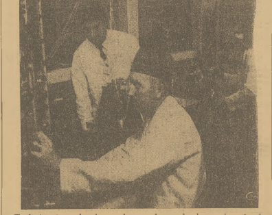
Technicy i mechanicy w laboratorium, które ma związek z najnowszą bronią, zmuszeni są pracować w czarnych szkodach.

ba było ściągać z innych wydziałów, ogalając je. Wśród 10,000 robotników w fabryce kędzierzyńskiej przeciętny wiek wynosi 29 lat. A wśród nich wielu pochodzi ze wsi i dopiero uczy się tajemnic obsługi skomplikowanych maszyn.