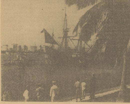
"Mayflower II", reprodukcja okrętu jakim przybyli pielgrzymi na wyspę Watson, przybył na Florydę, gdzie ma spędzić zimą.