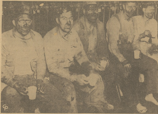
Podczas eksplozji, jaka nastąpiła ubiegłej nocy w kopalni w Amonate, Va., jedenastu górników poniosło śmierć. Formanek kopalni sam wyratował 14 osób. Pięciu ocalałych widzieliśmy na zdjęciu plących kawałkami papierosy na zewnątrz kopalni.