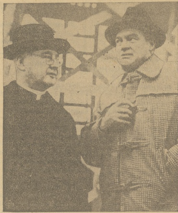
Arcybiskup New York — święt podczas których byli o Francis Kardynał Spellman i komi amerykańskich filmów, Bob Hope, złożyli sobie nawzajem życzenia z okazji