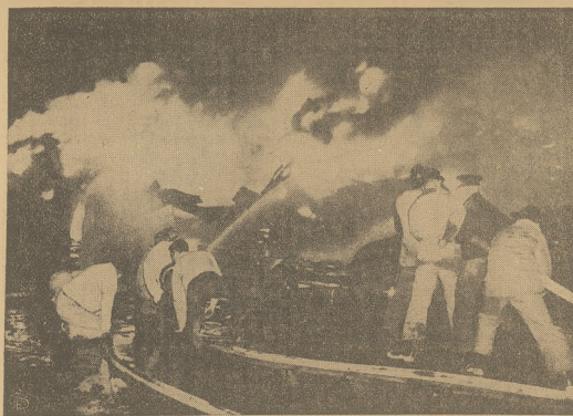
Podczas pożaru w Los Angeles spłonęło około 80,000 używanych opon, które były przeznaczone na przeróbkę. Straty wynoszą $750,000.