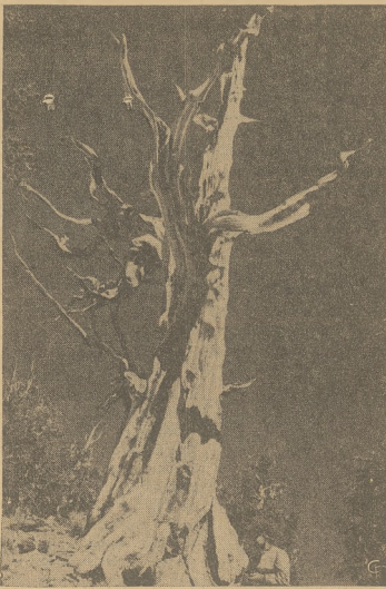
Podobno najstarszym drzewem na świecie jest "Pinus Aristata", drzewo które w naszym ciągu rośnie wśród starych drzew Kalifornii. Wiek jego botanicy obliczają na 4500 lat. Nie jest to wcale drzewo olbrzym. Obwód jego pnia wynosi zaledwie 5 stóp, a wysokość 30.