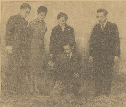
Japońska rodzina cesarska pozuje do zdjęcia w ogrodzie koło pałacu w Tokio. Zastępca tronu książę Akihito jest pierwszy z lewej strony a cesarz Hirohito stoi z brzesku na prawo.