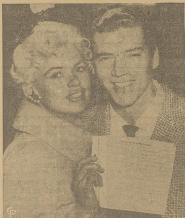
Aktorka filmowa J. Mansfield i Mickey M. Hargitz, zawarł związek małżeński. Na zdjęciu pokazują się ubiorem lajsens.