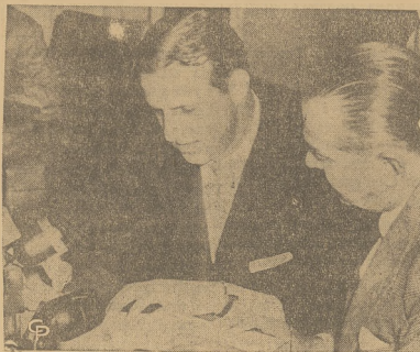
Charles Starkweather, 19 lat (na prawo), który został aresztowany pod zarzutem zamordowania 10-ciu osób, jest podobno cełnym strzelcem co stwierdza jego przyjaciółka,