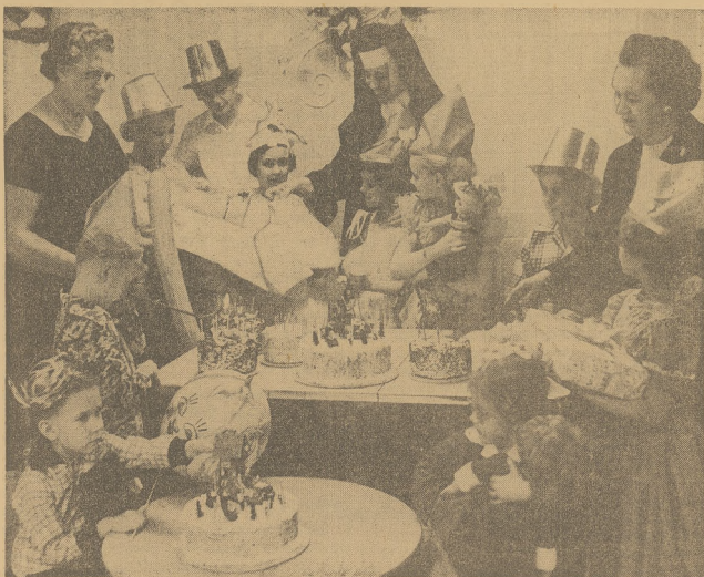
(Czartory Miłanowce Semelot)

Rocznie urodzin w sierocińcu św. Józefa często przypadają. Ostatnio 10 sierot obchodzilo rocznicę urodzin i dlatego też Stow. Polek Opiek nad Sierotami urządziło przyjęcie.