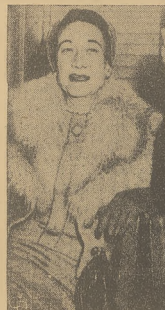
Książę i księżna Windsor, przybyli do Ameryki na statku "United States". W rozmowie z reporterami wyrazili oni wielki smutek z powodu