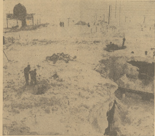
Wobec zbliżającego się lata, żołnierze marynarki rozkopują śnieg, który nagromadził się na dachach ich kwater przez długą i sroga zimę, w miejscowości podbiegunowej zwanej Mala Ameryka.