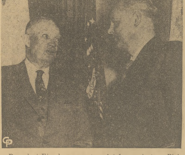
Prezydent Eisenhower rozmawia z sowieckim ambasadorem M. A. Menshikow, który złożył mu wizytę w Białym Domu, wkrótce po przybyciu do U. S.