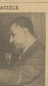
Prezydent Egiptu G. A. Nasser (na prawo) w chwili powitania króla Mohamed El Badr w Kairo, który przy-