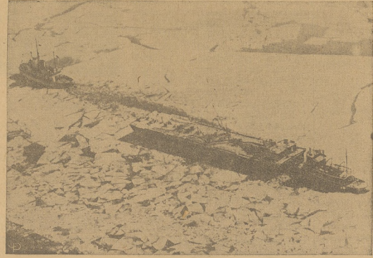
Piękne zdjęcie z lotu ptaka demonstruje kruszenie lodu w zatoce Chesapeake oraz Delaware Canal, przez tankowice wiozący ładunek oleju, który jest popychany od tyłu przez holownik i kierowany w stronę Kanalu.