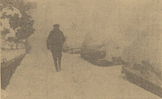
Ulica w mieście New York, pokryta śniegiem, którego warstwa dochodzi do dziesięciu cali. Wygląda pusto. Samotny człowiek widoczny na zdjęciu, boryka się z zawieją, brodząc w zaspach śnieżnych.