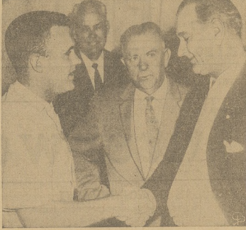
Lotnik Donald Farrell, który prześłał wszystkie doświadczenia, w związku z planowaną wyprawą na księżyc, przyjmuje gratulacje od Senatora Lyndona Johnston (D. Tex.), z powodu pomysłów odbytych prób.