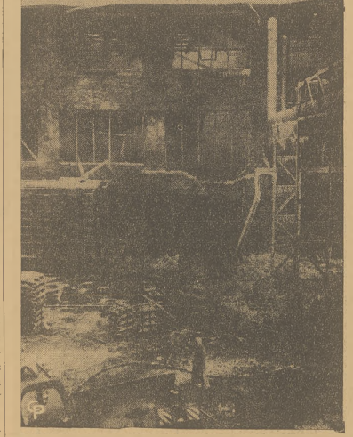
Zniszczenia są obliczane na jeden milion dolarów w Reynolds Metals Co, w McCook, Ill., z powodu nastąpienia eksplozji. Szesć osób poniosło śmierć, a 30 zostało rannych. Straż pożarna stara się wydosłać ciała zabitych z gruców.