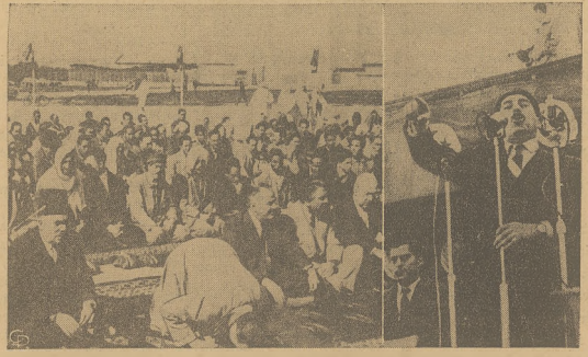
Podczas manifestacji w Tunisie, przeciw Francji z powodu zbombardowania pogranicznego miasta przez Francuzów, ludność odprawiała modły za poległych (na lewo). W tym samym czasie tunijski Sekretarz Stanu miał przemówienie, w którym tłumaczył nastawienie rządu w tej sprawie (na prawo).