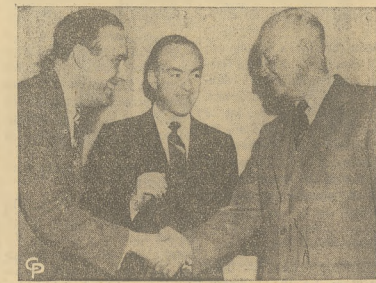
Prezydent Eisenhower ściągnął Roberta E. Merriama (na lewo), który został mianowany zastępcą Dyrektora Budżetu. Na stanowisko Dyrektora wszedł Maurice H. Stans.