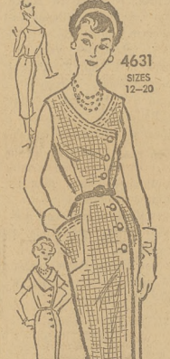
4631 SIZES 12-20 by Anne Adams

Sukieneczka na lato dla dziewczynki. Łatwa do użycia. Drukowane instrukcje.