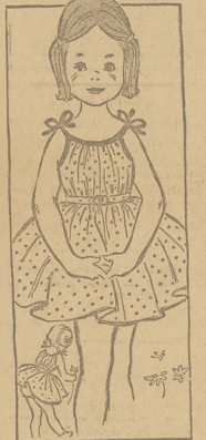
4672 SIZES 2-10 by Anne Adams