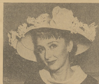
W Waldorf Astoria w New Yorku, podczas pokazu kapeluszki na Wielkanoc, Celeste Holm miała śliczny średnich rozmiarów kapelusz ozdobiony kwiatami.