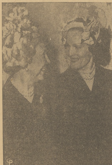
Pewnie że wiosna jest już z nami, o czym świadczy wiosenne modele kapeluszy jakie widzimy na głowach eleganek w Washingtonie. Między innymi był tam wydany o biad p. n. "Cherry Blossom Festival", z pokazem wiosennych modeli kapeluszy, gdzie były obecne p. D. Eisenhower i p. R. Nixon. Na zdjęciu są one widoczne w pięknych kapeluszach z kwiatów.

PRZYJACIELE CASTRA ARRESTOWANI W TEXAS BROWNSVILLE, Texas. — Grono 36 nowojorczyan, silnie uzbrojonych usiłowało wyjechać stąd statkiem na wyspę Kubę by przyjąć z pomocą przywódcy powstańców, Fidelowi Castro, ale... amerykańska straż nadbrzeżna, poinformowana o ich planie, poinformowała i osadziła wszystkich w więzieniu.