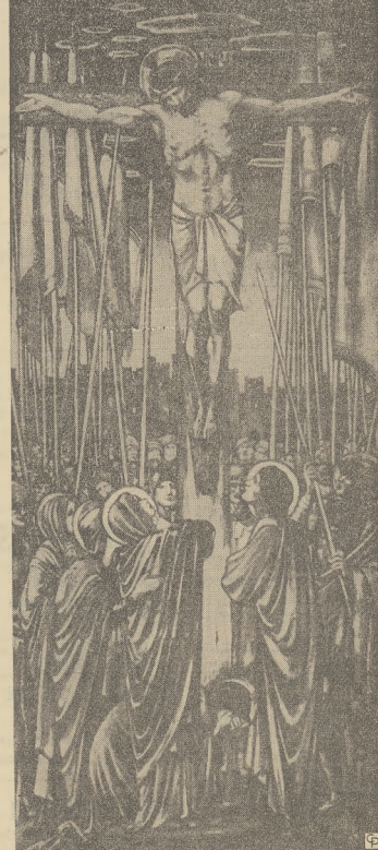
"Stoi pod krzyżem Jezusa Matka Jego, i Jego Matki siostra, Maria, żona Kleofasa, i Maria Magdalena. Kiedy Jezus zobaczył Matkę Swą, i stojących Apostołów, których kochał, rzekł do Matki Swjej: — "Kobięto, bacz Syna swego. I rzekł do uczniów swoich: "Baczcie Matki waszej!" (Św. Jan 19: 25-27.