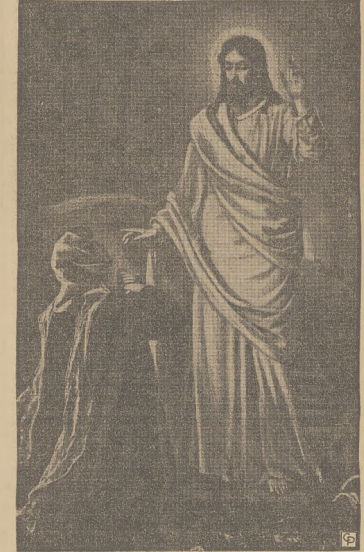
Rzekł jej Jezus: "Nie dołączaj się do was, bo nie jesteście z moim narodem, ale dołączcie się do braci Mojżesz i powiedz im: 'Wstępuję do Ojca Meogo i do Boga Meogo i Boga Waszego.'" (Św. Jan 20:17).