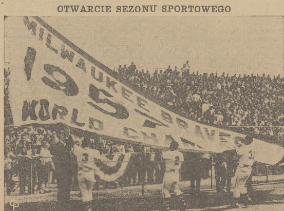
Piłkarska drużyna Braves z Milwaukee, która w ubiegłym roku zdobyła mistrzostwo, rozpoczęła sezon wczoraj na boisku Stadionu Powiatowego, spotkaniem z drużyną Pittsburgh Steelers.

Według opinii obserwatorów, mowa ta była przeznaczona wyłącznie na użytek wewnętrzny.