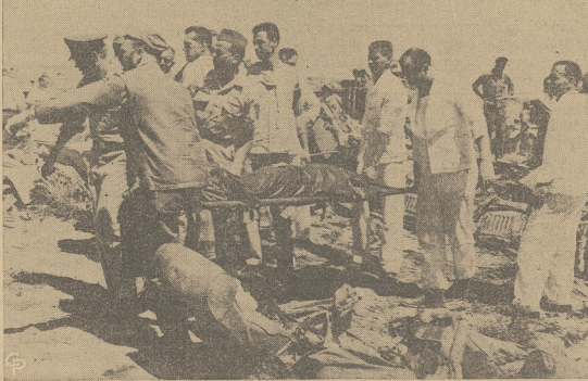
Samolot pasażerski United Air Lines, w okolicach Las Vegas, Nev., zderzył się z samolotem odrzutowym DC-7, który odbywał lot ćwiczebny. W strasnej katastrofie poniosło śmierć 49 osób. Zdjęcie przedstawia załogę ratowniczą podczas wydobywania z rumowisk ciał nieszczęśliwych ofiar.