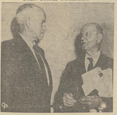
Gen. Omar Bradley (na lewo), przewodniczący Szefów Sztabu, rozmawia z przewodniczącym Kongresowej Komisji Zbrojeń, Carl Vinson. Gen. Bradley był obecnym podczas przedstawiania przez prezydenta Eisenhowera, planu reorganizacji Departamentu Obrony.