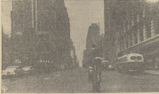
Ulice New Yorku opustoszały z rekordową szybkością podczas próbnego alarmu lotniczego. Na Herald Square został tylko samotny policjant na swoim posterunku.