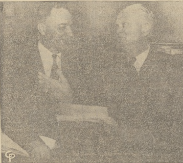
Dr. Arthur S. Flemming (na lewo) o Ohio, został mianowany przez prezydenta Eisenhowera na stanowisko ministra w Departamencie Zdrowia, Edukacji i Opieki Społecznej, na miejsce Marion Folsom.