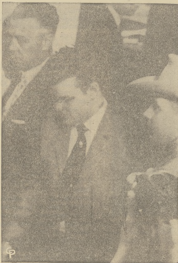
Morderca jedenasta osób, 19-letni Charles Starkweather jest prowadzony przed sąd w Lincoln, Neb.