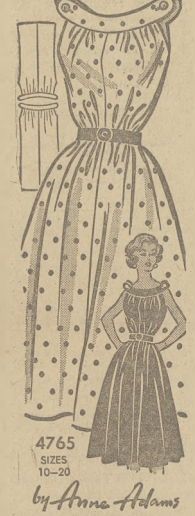
4765 SIZES 10-20 by Anna Adams

Ilustrowaną sukienkę użyć można w paru godzinach. Stanik i spódniczka w jednym kalkulu, bez szwów w pasie. Przepasana "cinch" paskiem. Drukowane instrukcje.