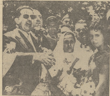
Gubernator Jacques Soustelle, po przybyciu do Algieru w ubiegłą sobotę, przemawiał na ulicy w Boufarik w której to mowie popierał Generała De Gaulle'a.