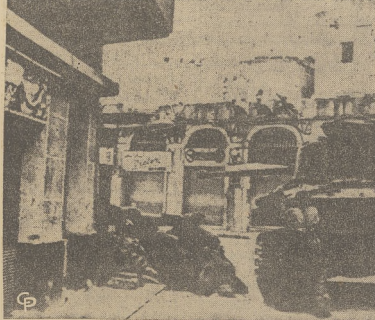
W Tripoli, głównym porcie strony rządu brały udział czolowicy, zgodnie z tradycją w Japonii, niecały popiół po każdym z spalonych, a adwokatci urni zabrali resztę popiołów wszystkich straconych, dla wszystkich razem więc wystawiają teraz mauzoleum.